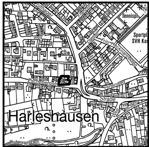
Karte der Stadt Kassel 1:5.000